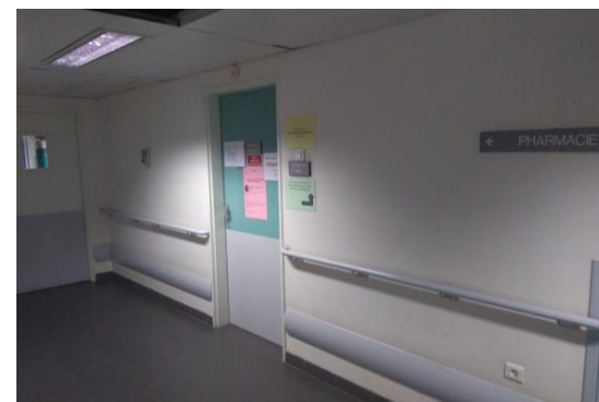
Entrée du local dédié aux rétrocessions à la PUI du CHICAS

Merci également de nous prévenir en cas d'arrêt du traitement ou de changement de lieu d'habitation temporaire ou définitif.